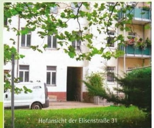
Hofansicht der Eisenstraße 31