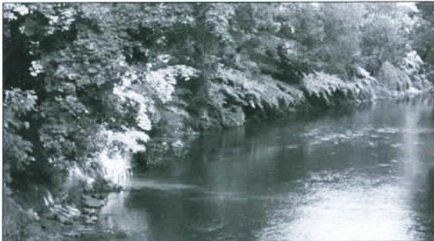
Attraktiv: Wohnen am Ufer der Chemnitz, grün und stadtnah.

und sind nach §34 BauGB bebaubar. Der als Beurteilungsgrundlage zugrunde liegende Gestaltungsplanentwurf mit Aussagen zur Bauweise, Gebäudeausrichtung, Geschossigkeit und Dachgestaltung wurde durch das Stadtplanungsamt zwischenzeitlich erarbeitet und trägt der Nachfrage nach innenstadtnahen Einzelhausgrundstücken Rechnung. Die größeren Grundstücke nördlich der Eckstraße sollen mittels Bebauungsplan und neu geordneter Erschließung entwickelt werden.